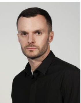
KRIS VAN ASSCHE Kris van Assche est créateur de mode.