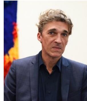
NICOLAS BOURRIAUD Nicolas Bourriaud est commissaire d'exposition, spécialisé dans l'art contemporain.