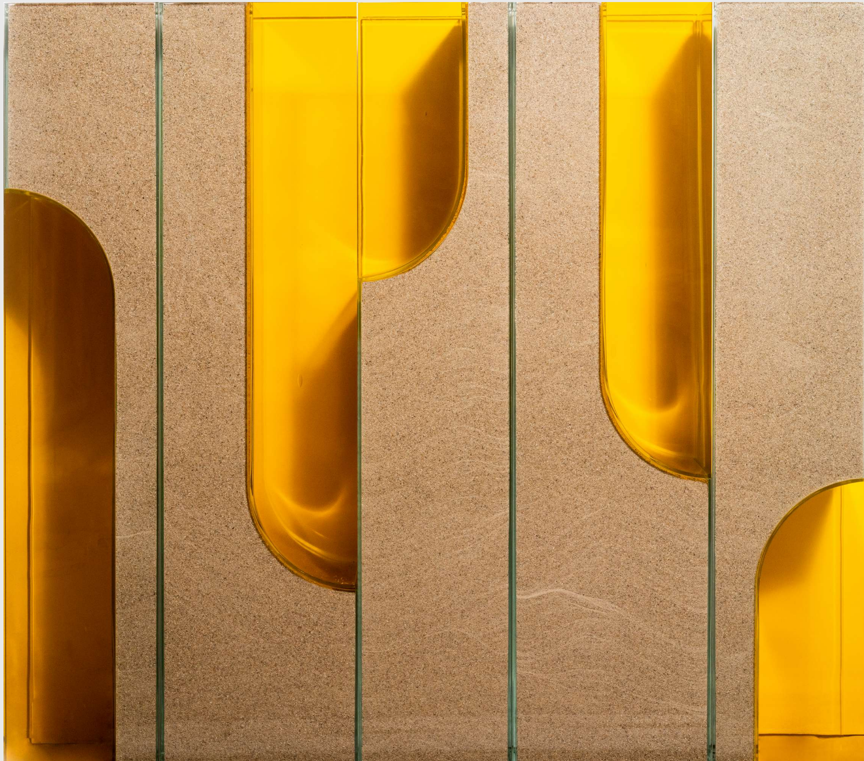
Kapwani Kiwanga Shifting Sands (yellow), 2023

Verre, verre coloré soufflé, sable de silice 70 x 80 x 15 cm Édition de 3 plus 2 épreuves d'artiste