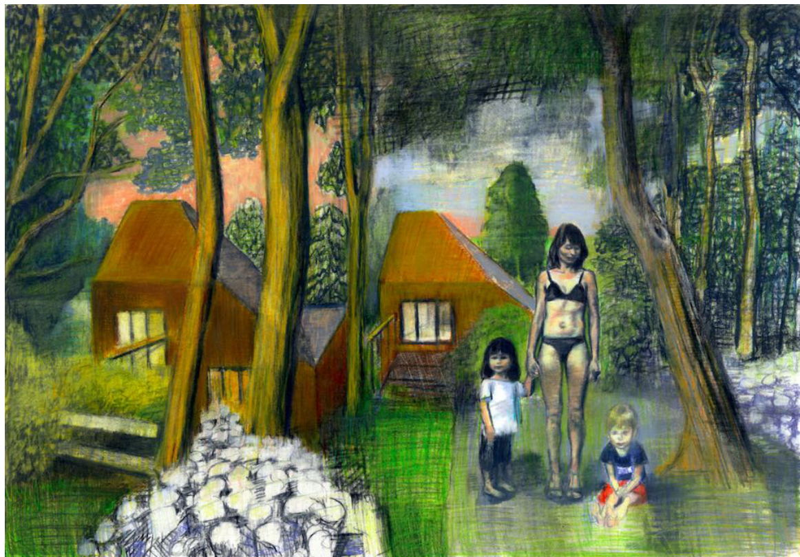
Portrait de famille #2, 2019