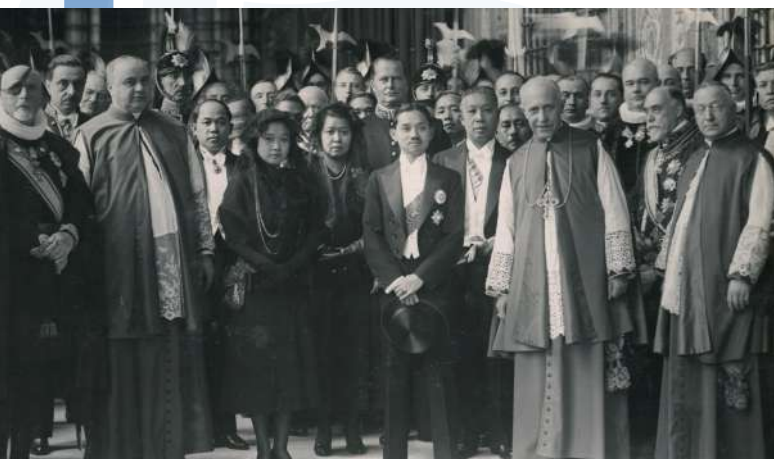
Visite à Rome du roi Rama VII en juin 1897.

Établies dès l'arrivée de Pierre Lambert de La Motte (1624-1679) ou de François Pallu (1626-1684), les institutions caritatives (écoles, lycées, universités, pensionnats, dispensaires, hôpitaux etc) sont ouvertes, sans distinction, à toute la population, apportant une contribution toujours grandissante et non négligeable à l'essor et au rayonnement de ce pays.