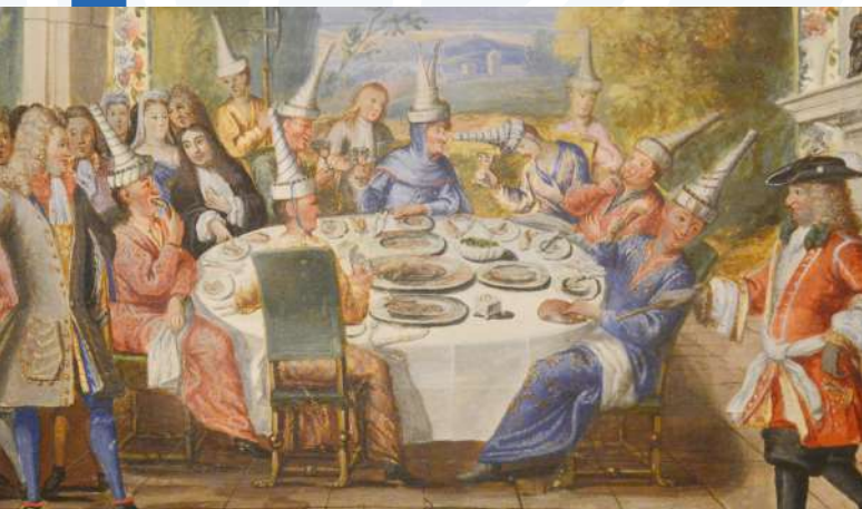
Réception des ambassadeurs siamois en 1680.