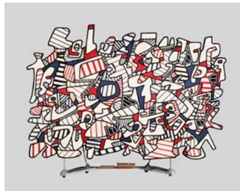
Jean DUBUFFET (Le Havre 1901 – Paris 1985)

La Fondation Pierre Gianadda en commun accord avec le Musée national d'art moderne – Centre Pompidou a décidé, devant les difficultés liées à l'évolution de la pandémie Covid 19, de reporter à l'année prochaine l'exposition « Jean Dubuffet, rétrospective » prévue du 3 décembre 2020 au 12 juin 2021